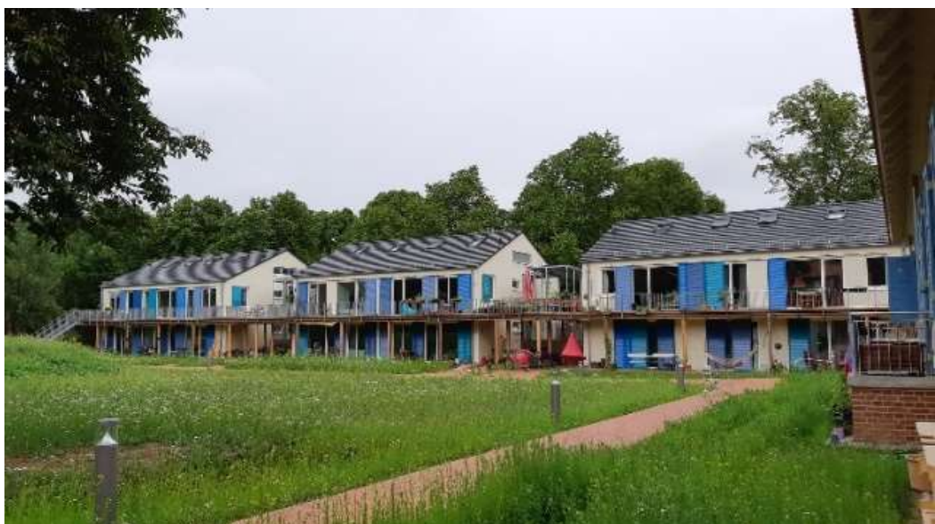
Beispielsbild: Unser Neubau in Hobrechts- felde